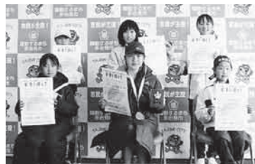
第13部 (3km 小4～6年女子)