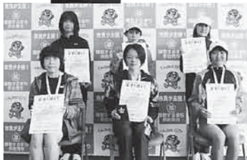
第9部 (5km 一般女子)