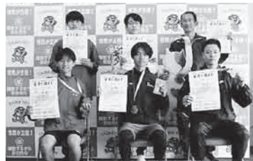
第10部 (3km 一般男子)