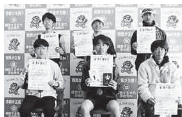
第1部 (10km 一般男子～34歳)