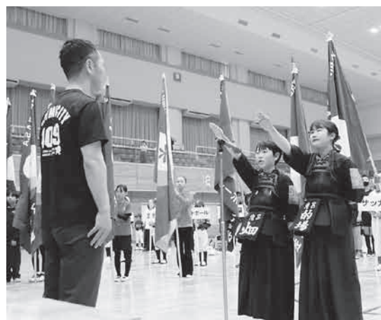
▲昨年の総合開会式の様子

春の恒例、多治見市民スポーツ大会を開催します。多治見市内に在住・在勤・在学の方なら、どなたでも参加できます。観覧も可能ですので、ぜひ足をお運びください。