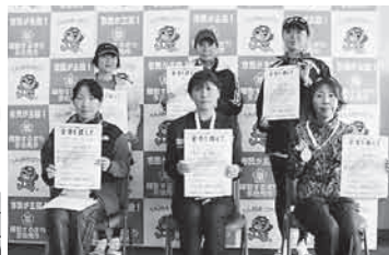
第6部 (10km 女子50歳～)