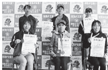
第5部 (10km 一般女子～49歳)