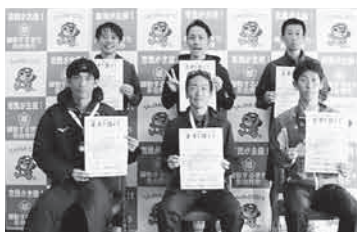
第2部 (10km 一般男子35歳～)