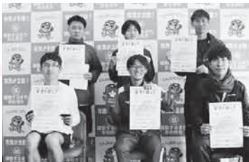
第8部 (5km 一般男子)