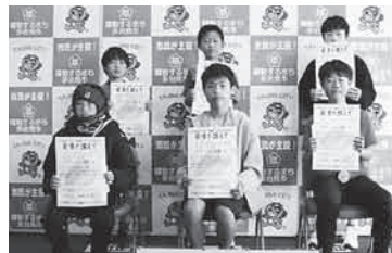
第12部 (3km 小学4～6年男子)