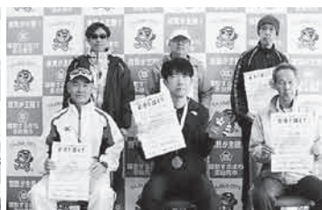
第4部 (10km 一般男子60歳～)