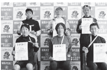
第3部 (10km 一般男子50歳～)