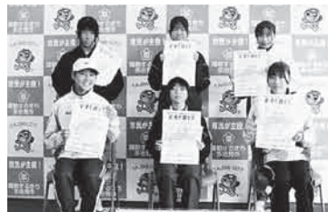
第11部 (3km 一般女子)