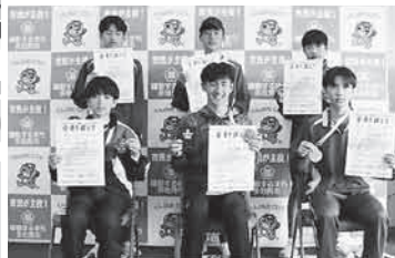
第7部 (5km 中学生男子)