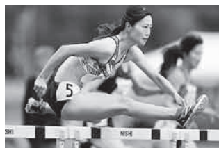
昨年の様子(2枚とも)